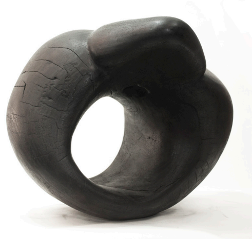
·《妙手之二》39 x 47 x 38 cm 雕塑(木) 2020年作 私人收藏