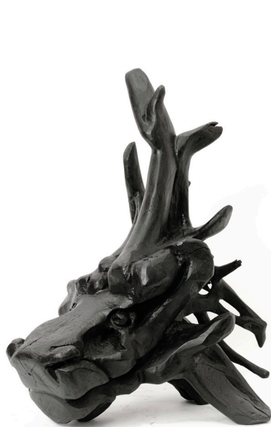
·《理想創造》47 x 37 x 58 cm 雕塑(木) 2012年作 HK$ 24000