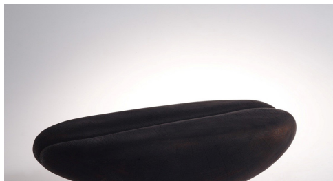
·《豆一》28 x 18 x 12 cm 雕塑(木) 2010年作 私人收藏