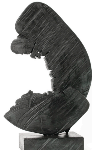
·《水滴》10 x 24 x 35 cm 雕塑(木) 2017年作 HK$ 15000