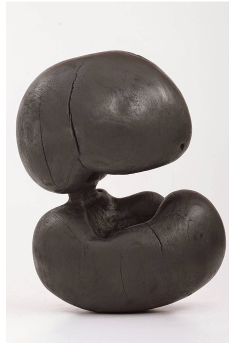
·《轉捩點》23 x 40 x 20 cm 雕塑(木) 2002年作 HK$ 26000