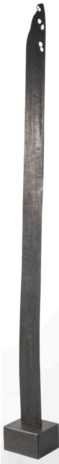
·《葉二》約200 x 22 x 19 cm 雕塑(木) 2020年作 HK$ 47000