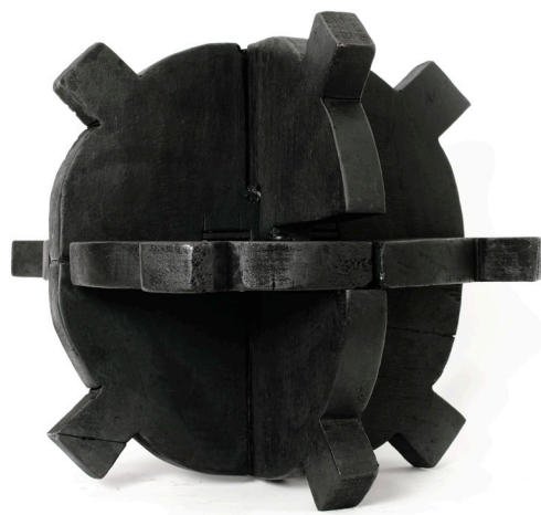
·《地球》雕塑(木) 43cm x 43cm x 43cm 2021年作 HK$ 26000