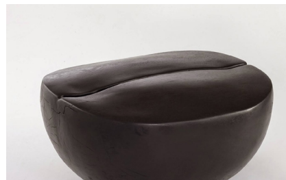
·《豆二》32 x 23 x 25 cm 雕塑(木) 2011年作 私人收藏