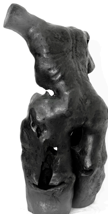
·《靈》60 x 30 x 88 cm 雕塑(木) 2010年作 HK$ 48000